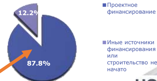
Источники финансирования жилищного строительства в Российской Федерации в 2022 году, млн кв.м: